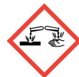
Attention, contient de